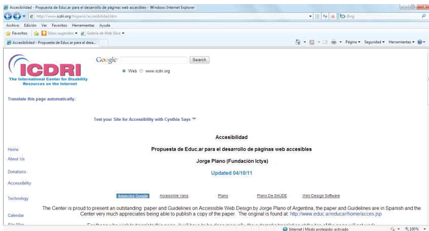
Figura N° 2 Sitio Web de ICDRI donde se puede probar el grado de accesibilidad de determinado sitio Web